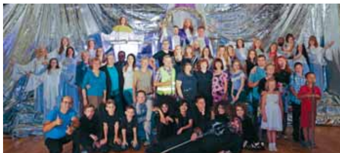
Drāmas aktieri un organizatori.