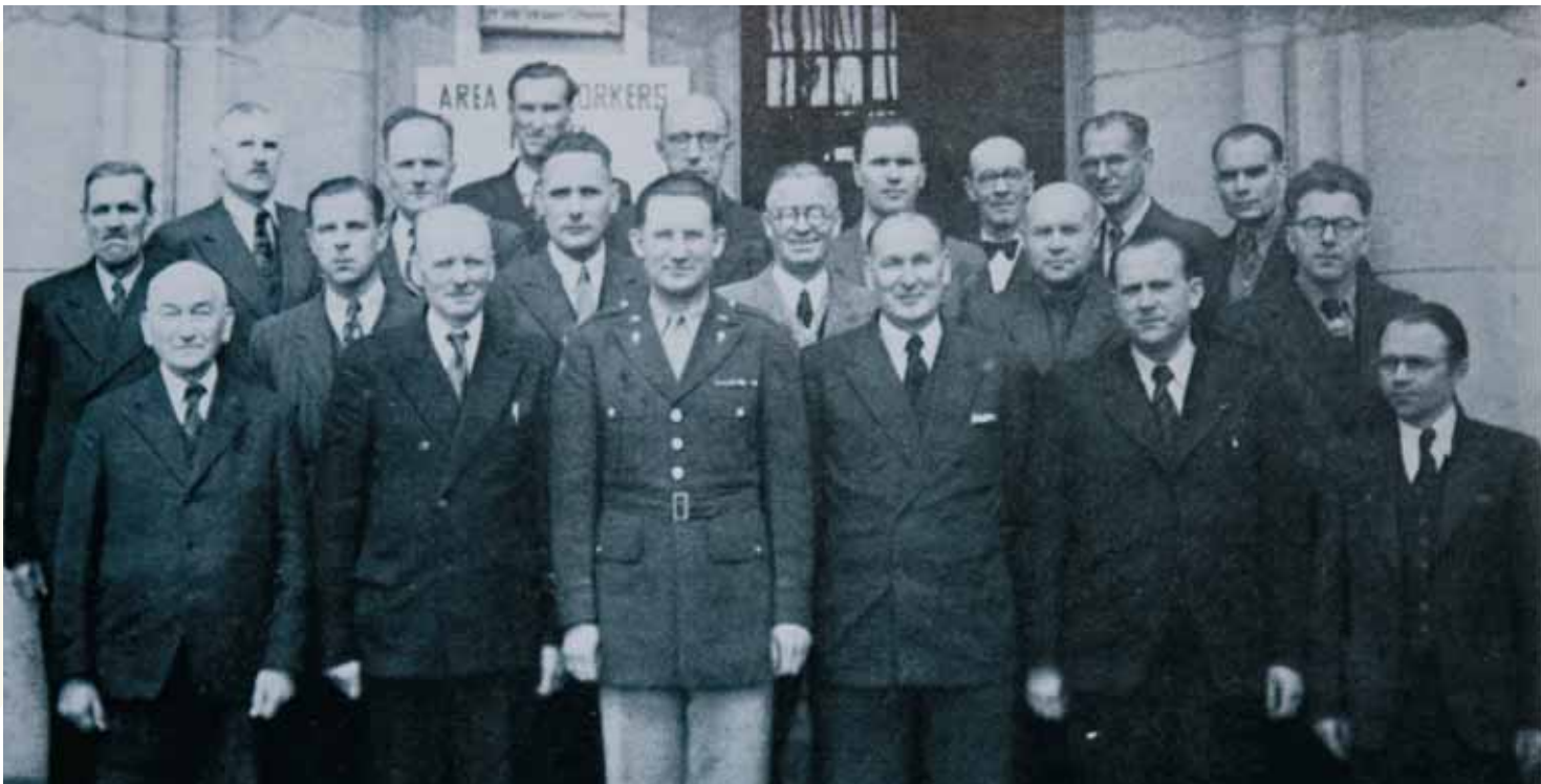
Latvijas baptistu mācītāju sanāksme trimdas laikā Vācijā 1948.gadā