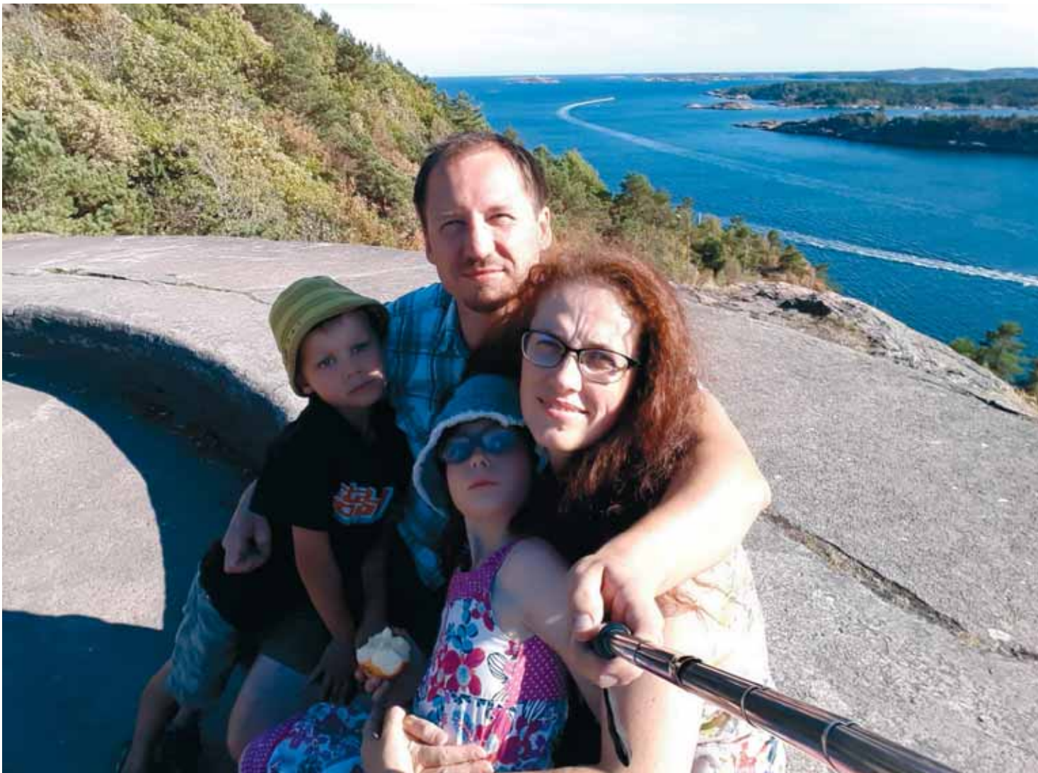
Kristiansandā pie Ziemeļjūras.