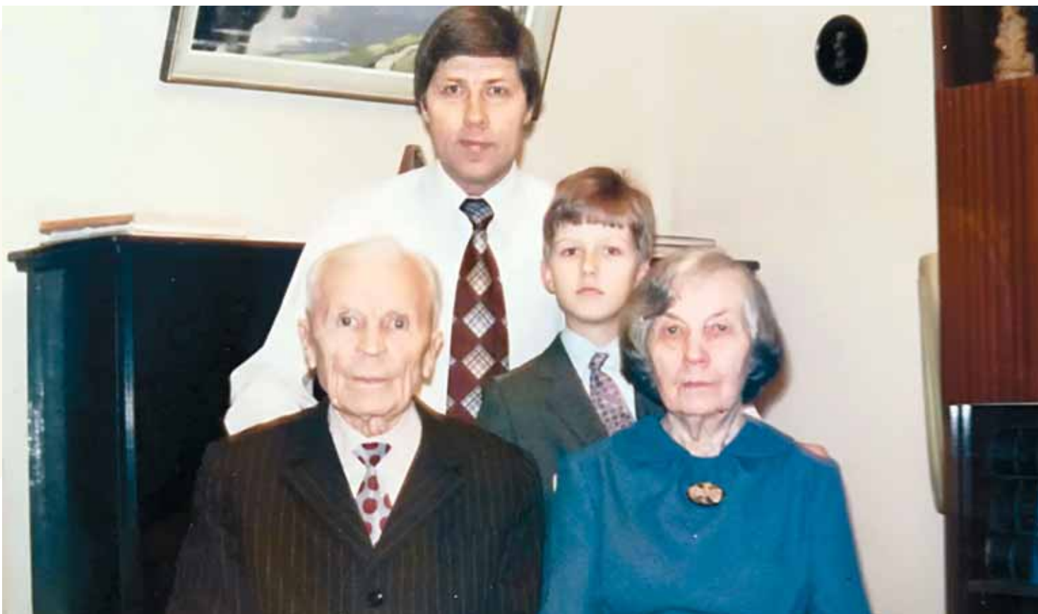
Kopā ar vecvecākiem un tēvu.

vadīja uz Ogres draudzi, kas nu jau 3 gadus ir mūsu garīgās mājas. Kaut gan katrai draudzei ir kur tiekties, augt, tomēr esam ļoti pateicīgi, ka šeit jūtama draudzes un vadītāju vēlme pēc dzīvām attiecībām ar Dievu!