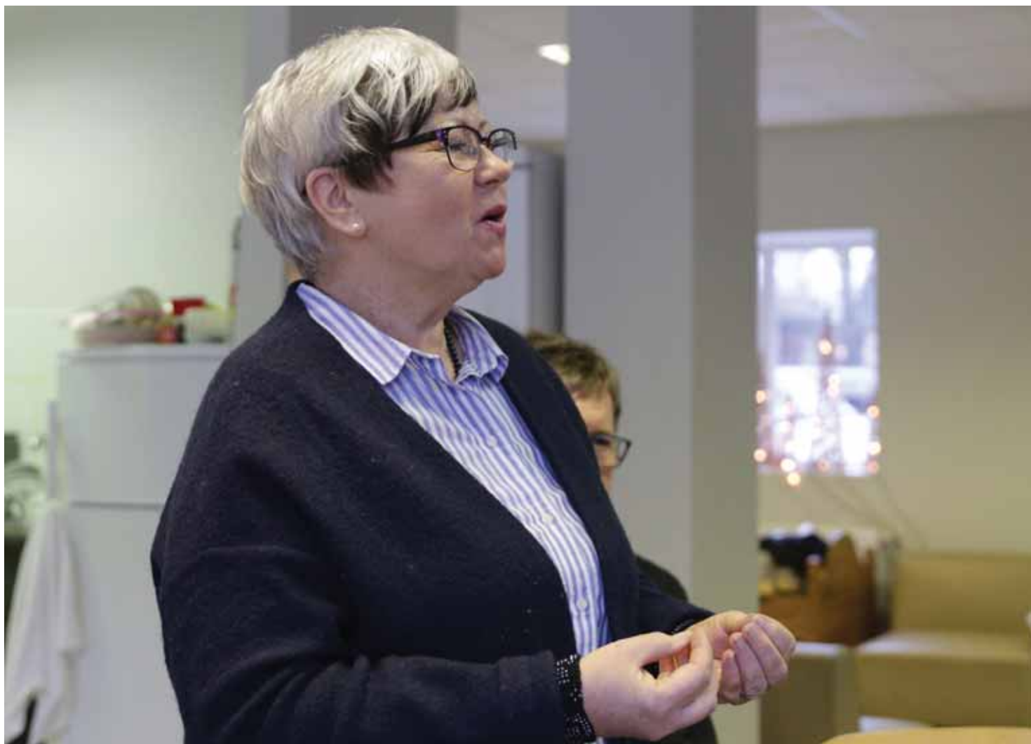
Uzrunājot Tabitas centra brīvprātīgos latviešus un norvēģus.

Kad pirms 21 gada sāku strādāt ar ielu bērniem Igaunijā, pirmais, ko iemācījos, bija kādi vārdi krievu valodā - “Ja tebja ļubļu” (Es tevi mīlu); “Moj drug” (Mans draugs). Pēc tam palēnām sāku viņus apskaut, samīļot, lai viņi jūt, ka es par viņiem rūpējos. Mums tajā laikā pietrūka vārdu, ko šiem bērniem teikt.