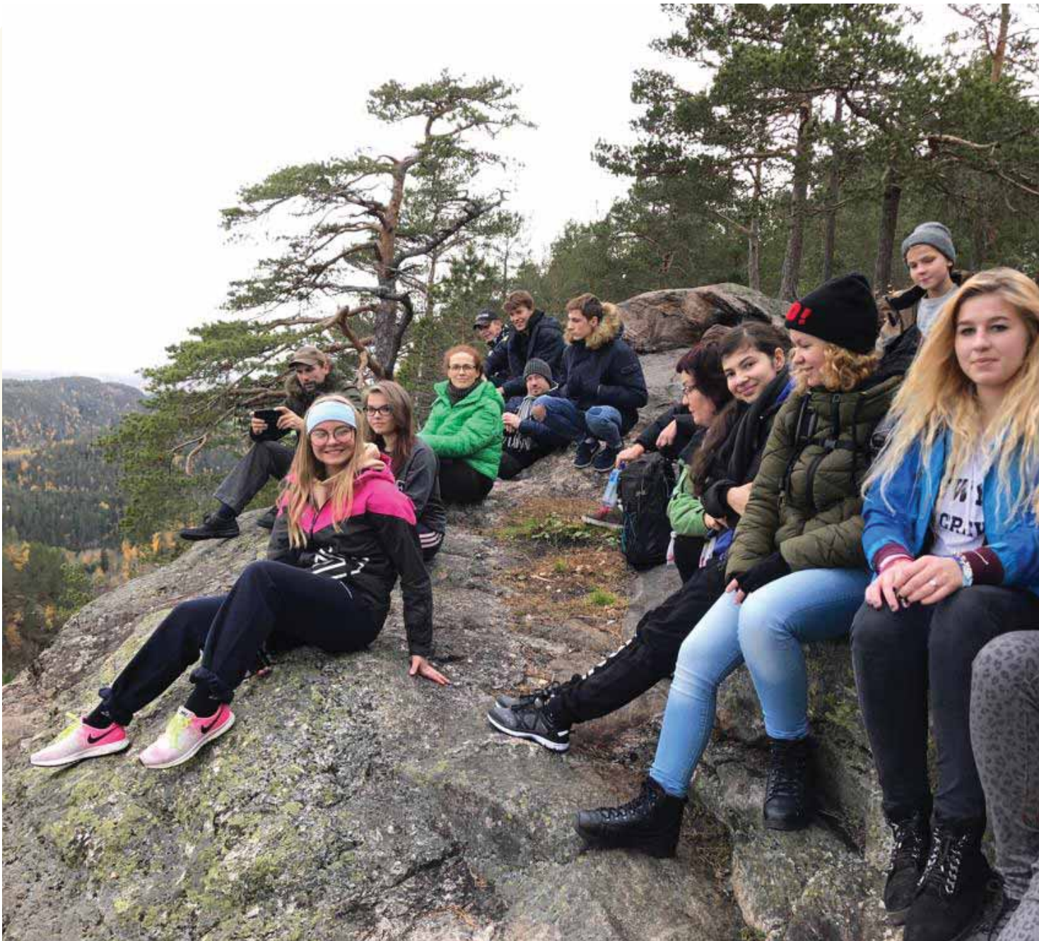
Pēc kāpiena Norvēģijas kalna virsotnē.

Pēcpusdiena aizrit svētītā gaisotnē, sarodas viesi - daudzas draudzes ģimenes, ir izvēlēta zupa, izceptas kūkas, smaržo kafija. Un atkal uzvirto sarunas par dzīvi Norvēģijā, par dzīvi Latvijā, par ģimenes centram "Tabita" Ogrē nepieciešamo, par nākotnes plāniem. Vakars aizrit līdz rītausmai, jo apjausma, ka jau rīt laiks doties mājup, mudina negulēt.