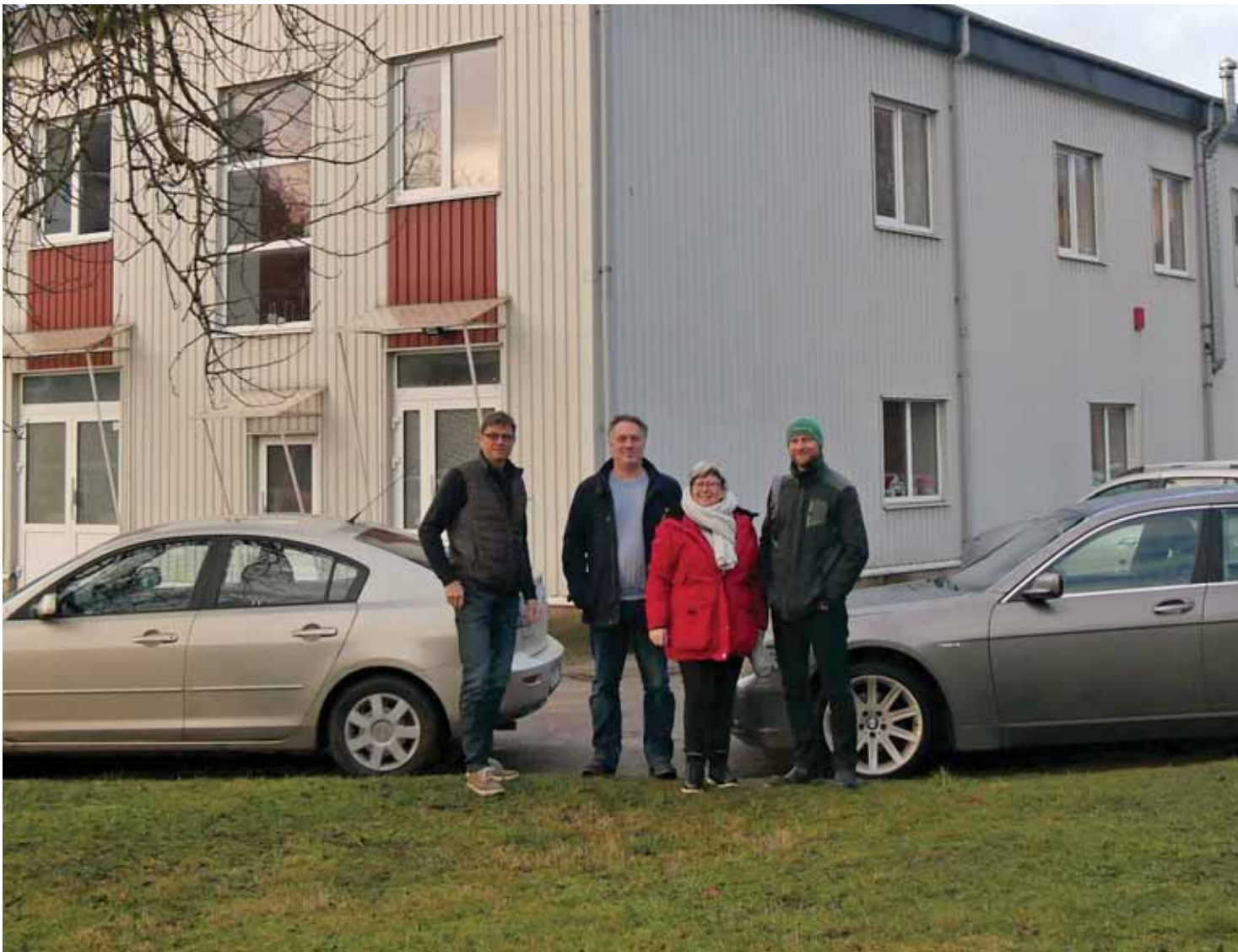
Pie Tabitas centra Ogrē.