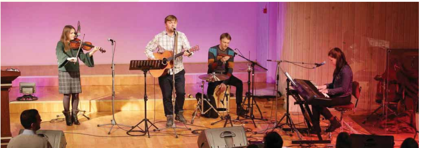
Jauniešu konference "Īstais cilvēks vai īstais aicinājums".

Ogres Trīsvienības baptistu draudzes avīze "Svētdienas Vēstis" 2019/01-03 (119), 2019. g. 17. februāris.