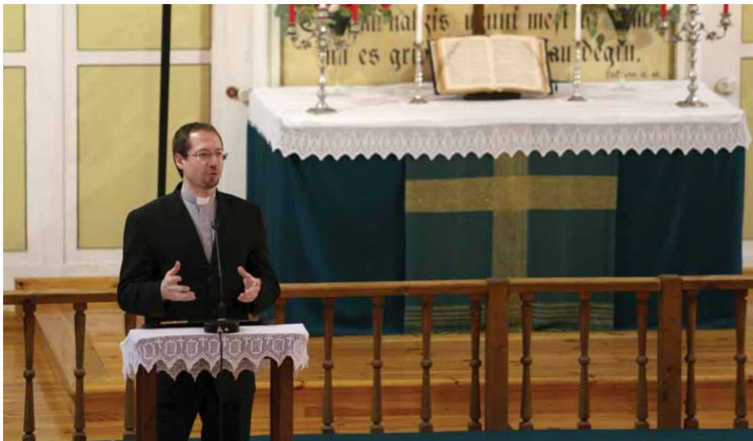
Ekumēniskajā dievkalpojumā 18. novembrī Ogres luterāņu baznīcā

kurā Dievs grib tevi ārstēt. Ne vienmēr mēs saprotam to veidu, kā tiekam ārstēti, tomēr Dievs tam var lietot katru draudzes locekli, kas šeit ir.