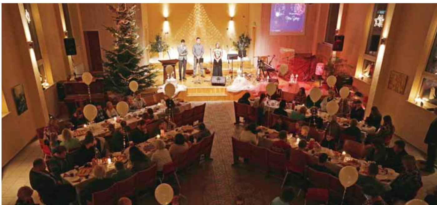
Draudzes gada noslēguma pasākums.