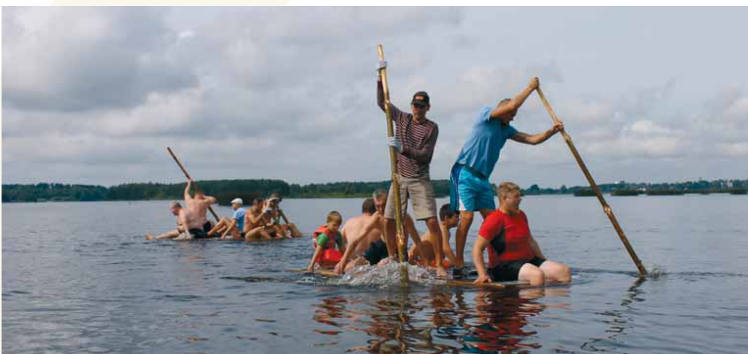
Plostu izaicinājums vīru pasākumā Daugavā pie Daugmales.